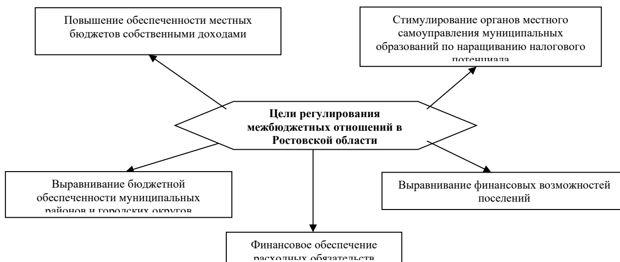
Рисунок 1 - Цели регулирования межбюджетных отношений в Ростовской области

На следующей странице приведен пример оформления рисунка с цифровыми данными (рис. 2).